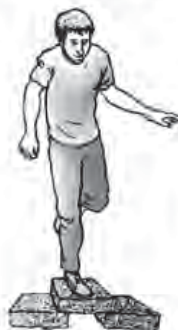
Prueba de resistencia de unidades de adobe