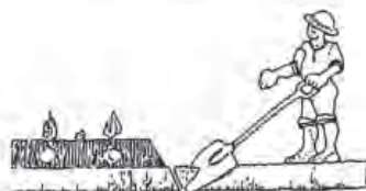
Muestra de campo