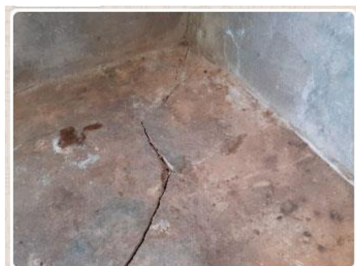
Esta son fotos de uno de los cuartos que están afectado este cuarto lo tenemos de bodega pero este es el que se a compensado a undir

Es importante mencionar que la profundización de las condiciones de los Pueblos Indígenas en El Salvador se hace más evidente enfocándose la problemática en el deterioro de la soberanía alimentaria, en el sentido que la mayoría de la siembra se había perdido. Así mismo el peligro por la acumulación de agua en las tierras para